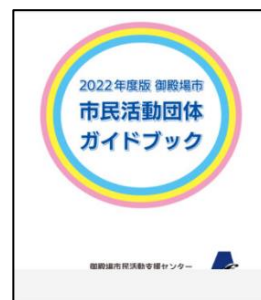
2022年度版 ガイドブック