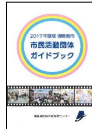
2017年度版ガイドブック